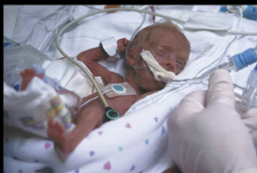
24-TÝŽDNOVÉ CHCENÉ DIEŤA ZACHRÁNENÉ V PÔRODNICI