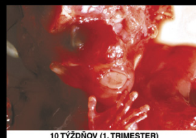
10 TÝŽŇOV (1. TRIMESTER)