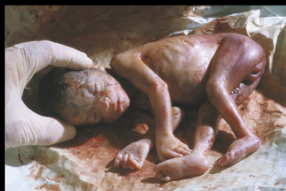
24-TÝŽDNOVÉ NEHCENÉ DIEŤA ZABITÉ V PÔRODNICI